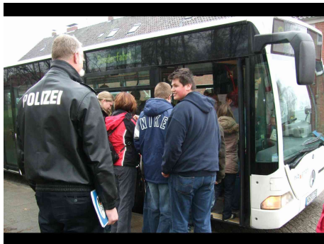
Einsteigen in den Bus