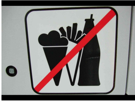
Schüler lernen die Schilder im Bus kennen

(Regentonne als Anschauungsobjekt). Anschließend wird an der Schule noch einmal das Überstreifen der Bordsteinkante ausprobiert (Regentonne als Anschauungsobjekt).