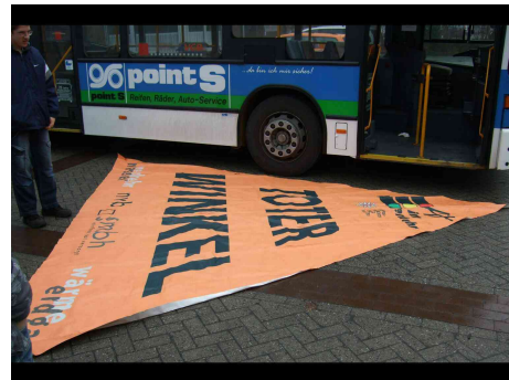
Größe des Toten Winkels beim Bus