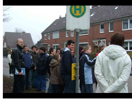
Warten an der Haltestelle