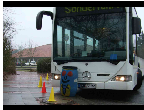
Bei der Anfahrt auf die Haltestelle kann der Bus die Bordsteinkante bis zu drei Metern überstreifen